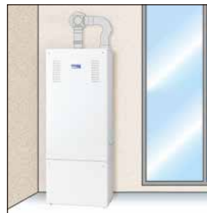
図はイメージです。